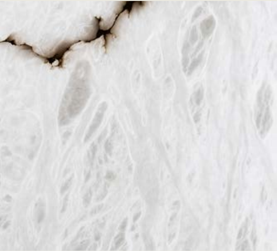
EBRO Reconocido por su translucidez lechosa y su veteado en tonos tierra y grisáceos.

Seleccionamos la veta adecuada para cada proyecto.