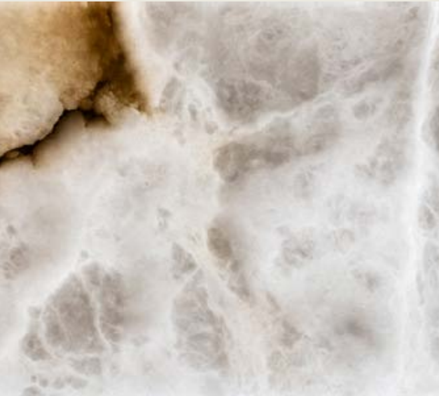
ZAIDA Destaca por su translucidez excepcional en blanco nieve, con vetas en tonos tierra rojizos y sutiles texturas nubosas.

En la actualidad, comercializamos 2 modelos de alabastro: