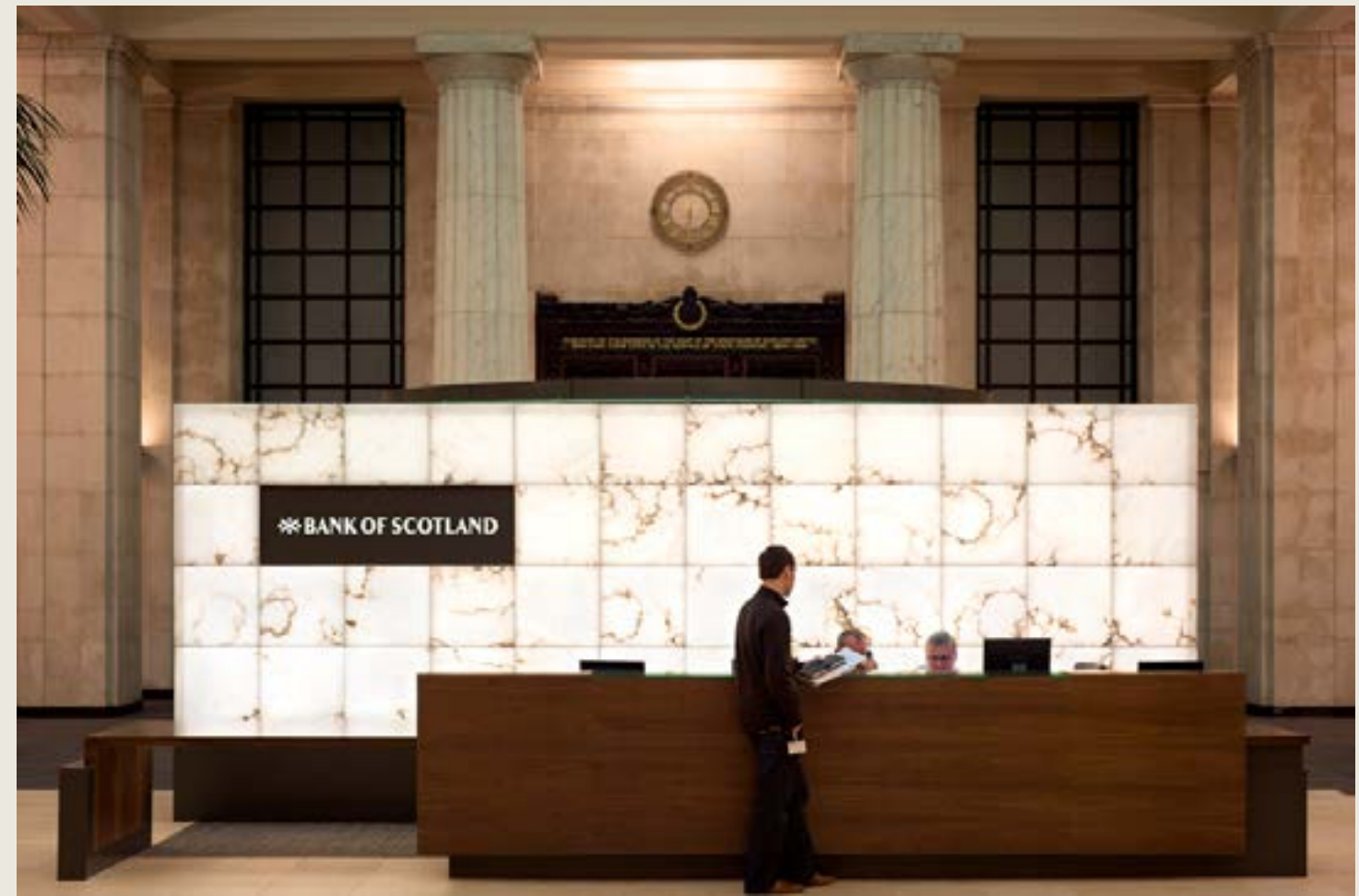
Banco de Escocia