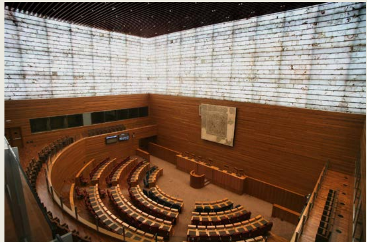
Cortes Castilla y León