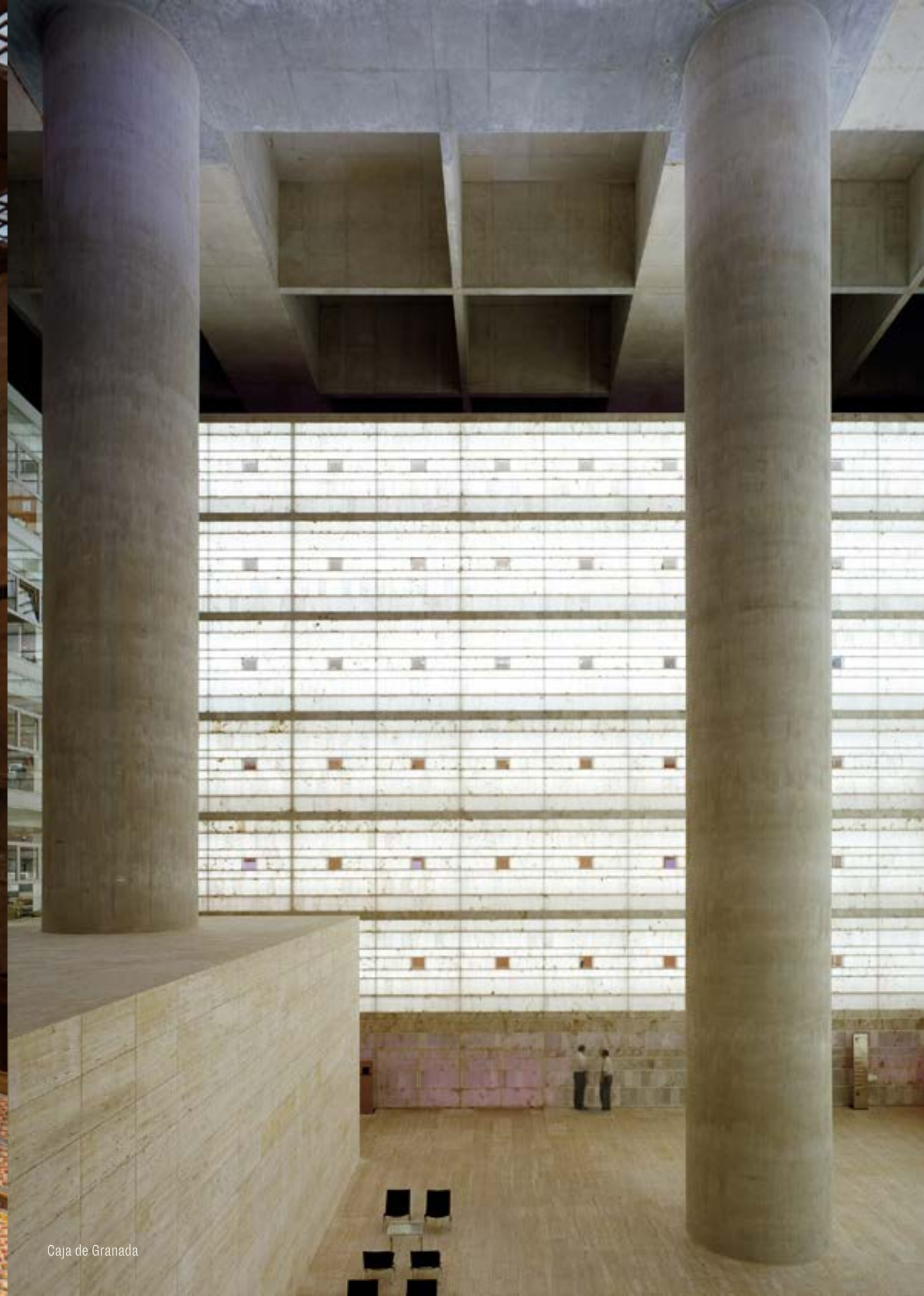
Caja de Granada